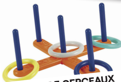
JEUX DE CERCEAUX