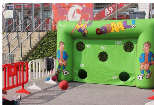
TIRE AU BUT